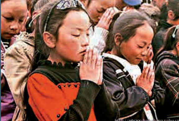
▲孩子們在為阿福唸經祈禱

【大公報記者代洪十三日電】4月14日上午，「綠色感恩、生態報國」新玉樹在行動主題活動啟動儀式在格薩爾廣場舉行。有來自北京市、遼寧省黨政領導，中國建築、中鐵建、中鐵工、中國電建總部及中規院領導，青海省委、省政府有關部委領導，玉樹州及六市縣黨政領導、州直機關單位幹部職工、學校師生、寺院僧侶、醫院醫護人員、駐地軍警、工商界、結古地區群眾等各界代表約3000人參加大會。