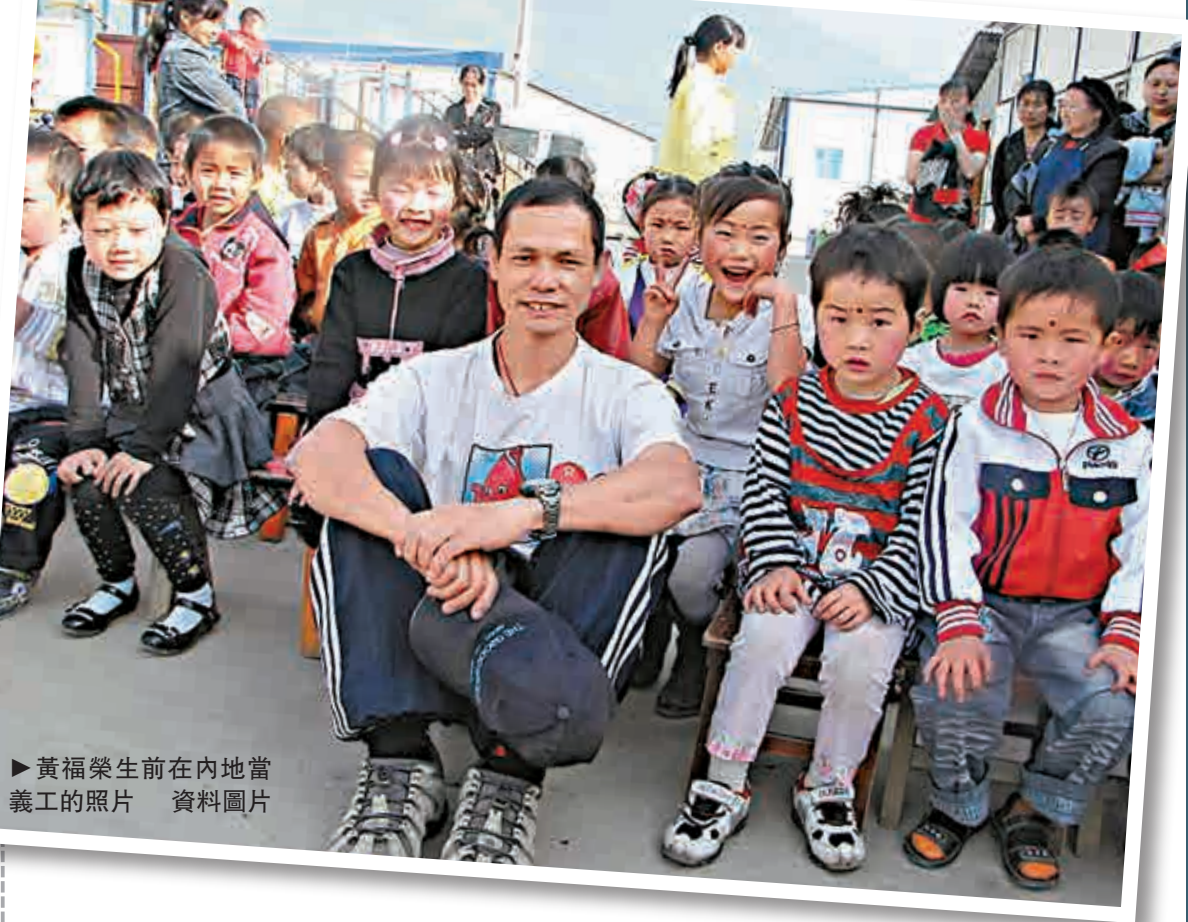
►黃福榮生前在內地當義工的照片 資料圖片

【大公報記者代洪西寧十三日電】加秀·阿周表示，自從阿福去世後，孤兒院的孩子們不定期的給阿福寫了很多思念的卡片，至今有400多張，有一次阿周跟孩子們說要把這些卡片上傳到網上，為了讓更多的人知道阿福、更多的人向阿福學習這樣一個想法。但是孩子們表示不願，說「哥哥，我們寫的東西不要放在網上，因為這是我們對阿福的一種悄悄地思念和聊天的一種方式，是留在心底的紀念。」