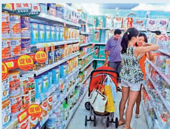
▲廣州「港貨店」老闆坦言會考慮增加招攬港人「走水貨」

為了維持「港貨店」經營，劉老闆坦言會考慮增加招攬多些香港人「走水貨」，雖然人工成本支出預計會多出30%左右，但相比持「一簽多行」的內地人通關時容易被密集盤問，乃至可能被拒絕入境，持有香港身份證的居民一般不用擔心這些問題。他也預計，受貨源限制、水貨成本上漲等影響，包括奶粉等部分熱門港貨或出現一定幅度的漲價，「這會不會影響新老顧客的購買慾？現在惟有見步行了」。