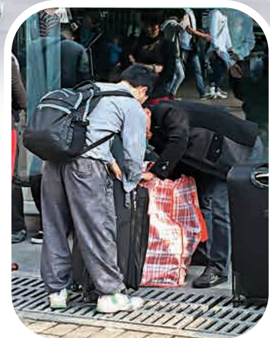
▲福田口岸外水貨客正在交易

有旅遊業界人士稱，若深圳戶籍居民赴港「一簽多行」政策擬調整為「一周一行」，深圳戶籍人士或因此增加在港的「過夜消費」。也有可能出現市民集中在周末或節假日前往香港掃貨，因少了「一簽多行」的分流，料旅客過關會增加排隊時間。