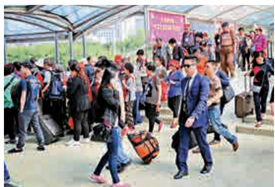
▲「一周一行」新政當日，深圳各口岸仍如往常一樣繁忙

「新政會大幅度提升持『一簽多行』水客的時間成本，從而降低深圳戶籍水客赴港走私水貨的經濟誘因，能有效減少職業水客的數量。」深圳海關人士預測，新政對內地水客的衝擊會在未來一年內逐步顯現，至今年底持「一簽多行」的水客數量將降至最低谷。