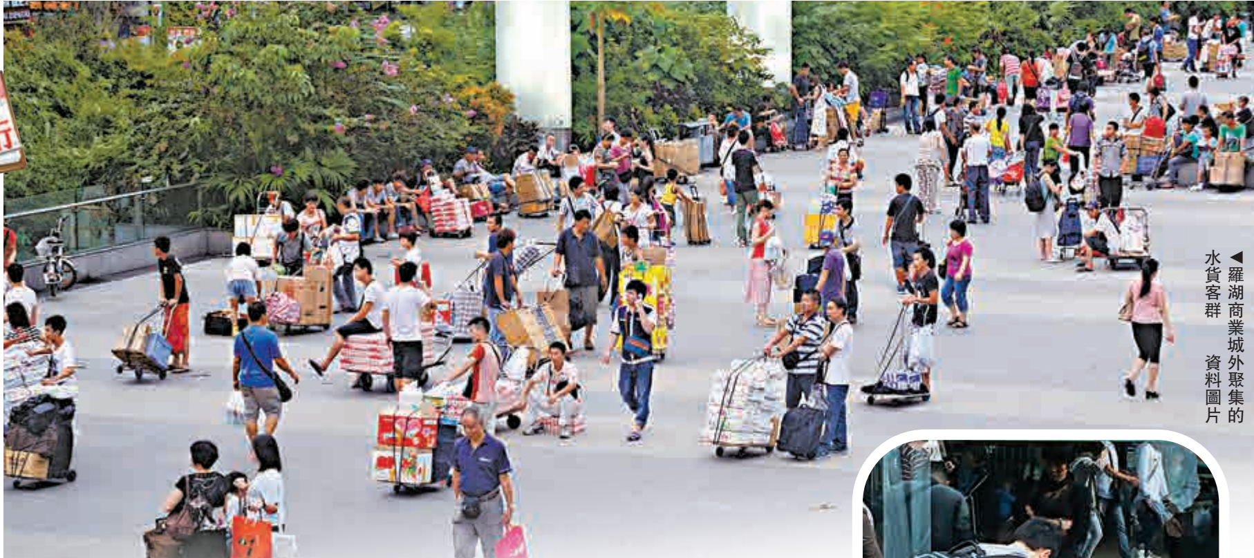
▲羅湖商業城外聚集的水貨客群