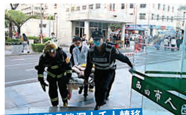
川倉庫化學品泄漏上千人轉移

「一般而言，皮衛星只是作為大衛星的伴飛星，皮衛星經大衛星中轉之後才與地面通信，而我們研發的這類衛星是要直接完成與地面的通信任務，國內是空白，我們也是第一個吃螃蟹的。」參與製作的學生向記者介紹說。記者了解到，他們放棄了春節放假與家人團聚，幾乎吃喝睡都在實驗室，反覆試驗摸索終於取得了成功。