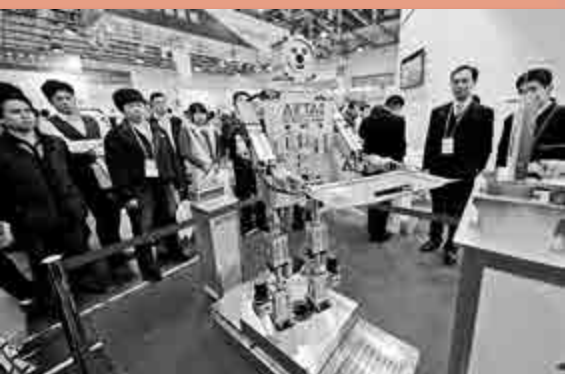
▲工博會上迎賓機器人吸引觀眾眼球