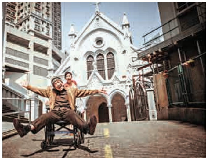
▲《紅色的天空》描寫老年人的處境