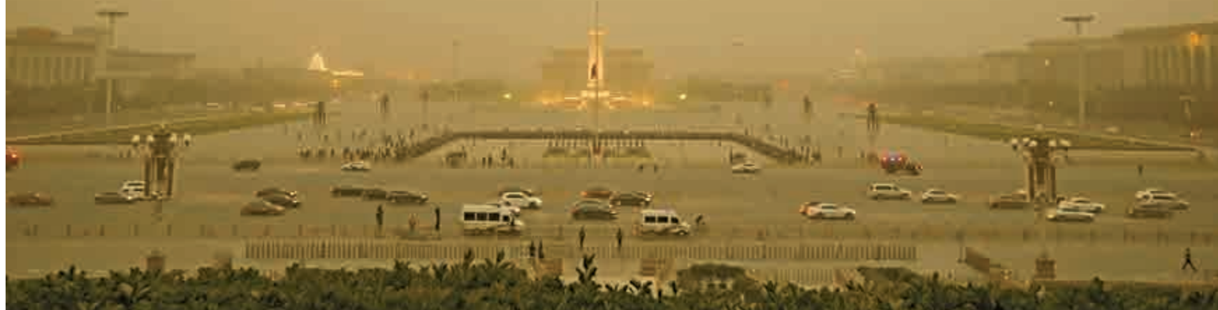
▼15日傍晚沙塵籠罩天安門廣場