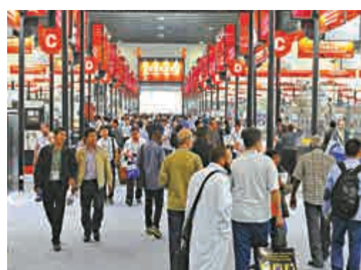
▲目前機電產品出口仍以歐美為主