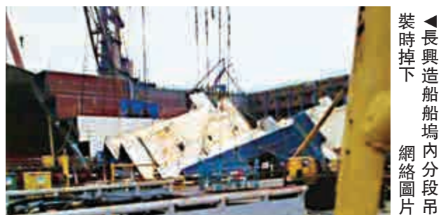
▲長興造船廠內分段吊裝時掉下 網絡圖片