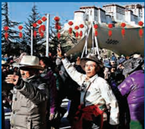
▲西藏民眾在布達拉宮前跳舞

1980年以來，中央先後五次召開西藏工作座談會，從中國社會主義現代化建設全局出發，對西藏的發展建設作出整體規劃。從1994年中央第三次西藏工作座談會開始，中央實施對口支援西藏的政策，安排60個中央國家機關、18個省市和17家中企對口支援西藏。20年來，先後有七批5965名優秀幹部進藏工作，實施援藏項目7615個，投入援藏資金260億元，主要用於改善民生和基礎設施建設，為西藏經濟社會發展作出了重要貢獻。2010年中央第五次西藏工作座談會後，中央政府按照省市財政收入的千分之一核定17個援藏省市的援助資金量，並建立了穩定增長機制。