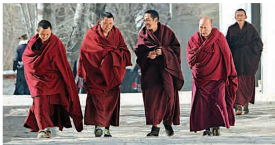
▲拉薩色拉寺僧人在寺廟院子裡