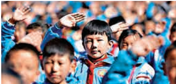
▲今年3月27日， 拉薩市第一小學舉行升國旗儀式， 迎接西藏百萬農奴解放56周年紀念日

白皮書最後指出，西藏的發展道路是歷史的選擇，人民的選擇。任何人和任何勢力企圖逆歷史潮流而動，其結果只能被歷史和人民所拋棄。