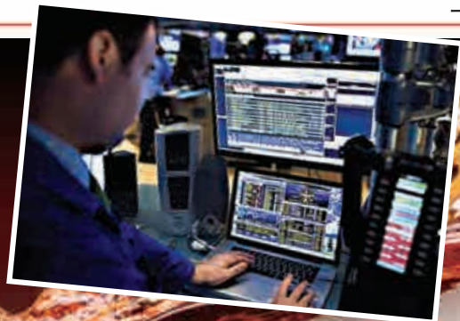
交易所的員工使用彭博機查看實時股價 互聯網

但英國廣播公司（BBC）記者萊納姆指，彭博強調並非因為倒瀉可樂，亦非電子攻擊引發。彭博在推特發表聲明說：「現階段沒有跡象顯示，今次事故和內部網絡問題以外的事件有關。」彭博一名發言人其後亦強調，沒有發生過打翻可樂事件，交易終端死機是內部網絡出現問題，正調查事件起因，未有證實相關報道。