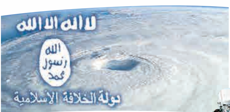
因與恐怖組織同名，「Isis」被氣象組織從颱風名中剔除

黎加開會後，決定剔除此名字，以「伊維特」（Ivette）代替。WMO以往也會把造成嚴重人命傷亡的颶風/颶風名字移除，例如去年在墨西哥造成11人死亡和嚴重破壞的颶風「奧迪勒」（Odile），將不會再出現，取而代之的是「奧達利斯」（Odalis）。據悉，WMO有6張颶風/颶風名單，都是由A到Z，輪流使用。