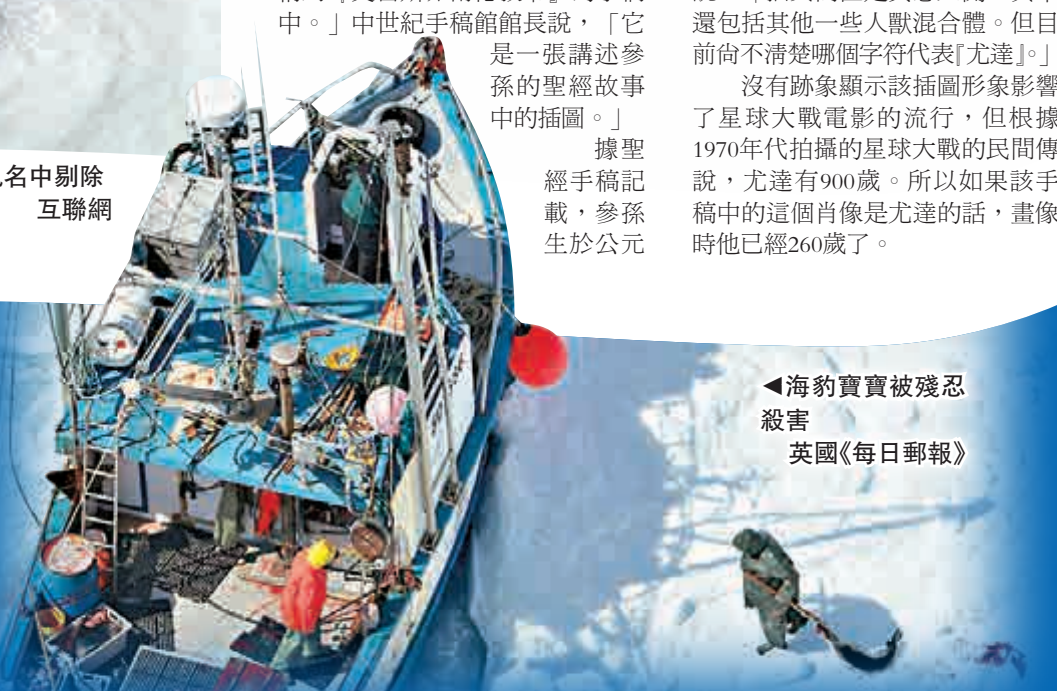
海豹實寶被殘忍殺害 英國《每日郵報》

或被活活打刺剝取完整毛皮。有些小海豹浴血瀕死，還想抬頭掙扎；另一隻被刺殺後，屍體丟到一邊雪地上，再滑進冰冷染血的水裡，死無葬身之地。 隨着歐美、台灣、俄羅斯等地禁售狩獵海豹所得的產品，海豹產品在全球需求急速減少，但紐芬蘭政府仍稱會提供數以百萬英鎊補助，拯救這門夕陽行業，每年容許捕殺468,000隻冠海豹和灰海豹。HSI行政總監奧德沃思透露，儘管加拿大承認倉庫內其實積存了大量海豹毛皮賣不出去，但海豹實寶仍在政府援助下不斷被殺，令人髮指。