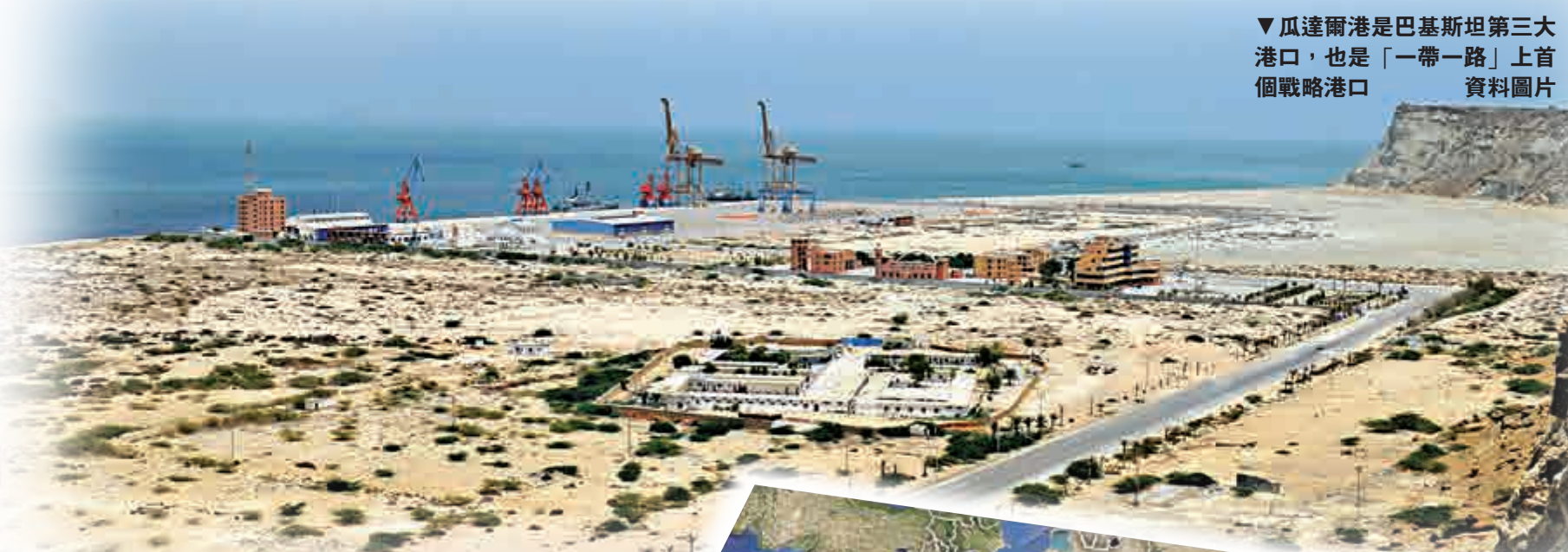
瓜達爾港是巴基斯坦第三大港口，也是「一帶一路」上首個戰略港口 資料圖片