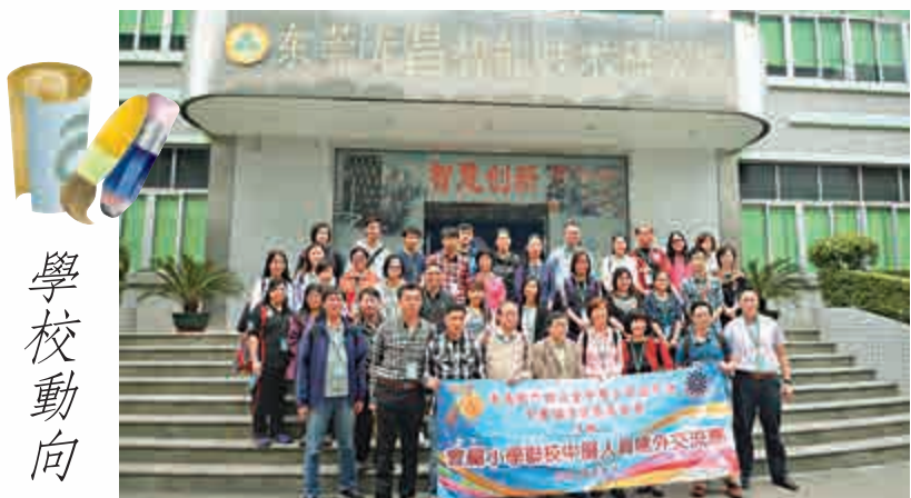
香港佛教聯合會會屬小學校長及中層領導人員參觀東莞龍昌玩具廠

時間：4月19日上午九時至下午五時 地點：新界葵涌梨木樹邨第三座校舍 電話：24248871