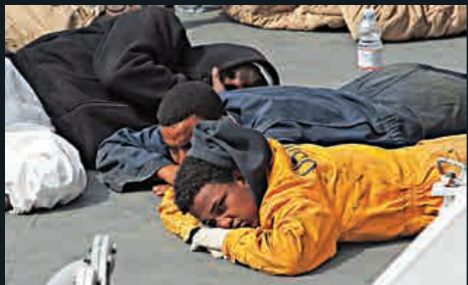
▲獲救難民20日趴在意大利海警船的甲板上

【大公報訊】綜合法新社、英國《每日電訊報》及《獨立報》20日報導：地中海兩日內發生三起北非難民船沉船事故，近千人葬身大海。周日在意大利藍佩杜薩島傾覆的難民船，死亡人數增加至950人；周一，又有一艘難民船在希臘愛琴海觸礁擱淺，造成至少3人死亡，死者包括小孩；同日，意大利「國際移民組織」（IOM）收到報告，指一艘載有300人的偷渡船在地中海沉沒，至今已造成20人死亡。