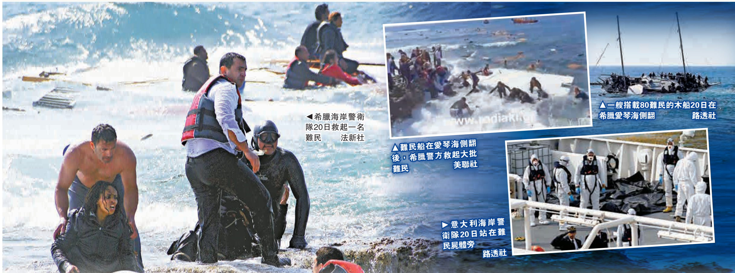
▲希臘海岸警衛隊20日救起一名難民