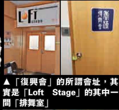
▲「復興會」的所謂會址，其實是「Loft Stage」的其中一間「排舞室」