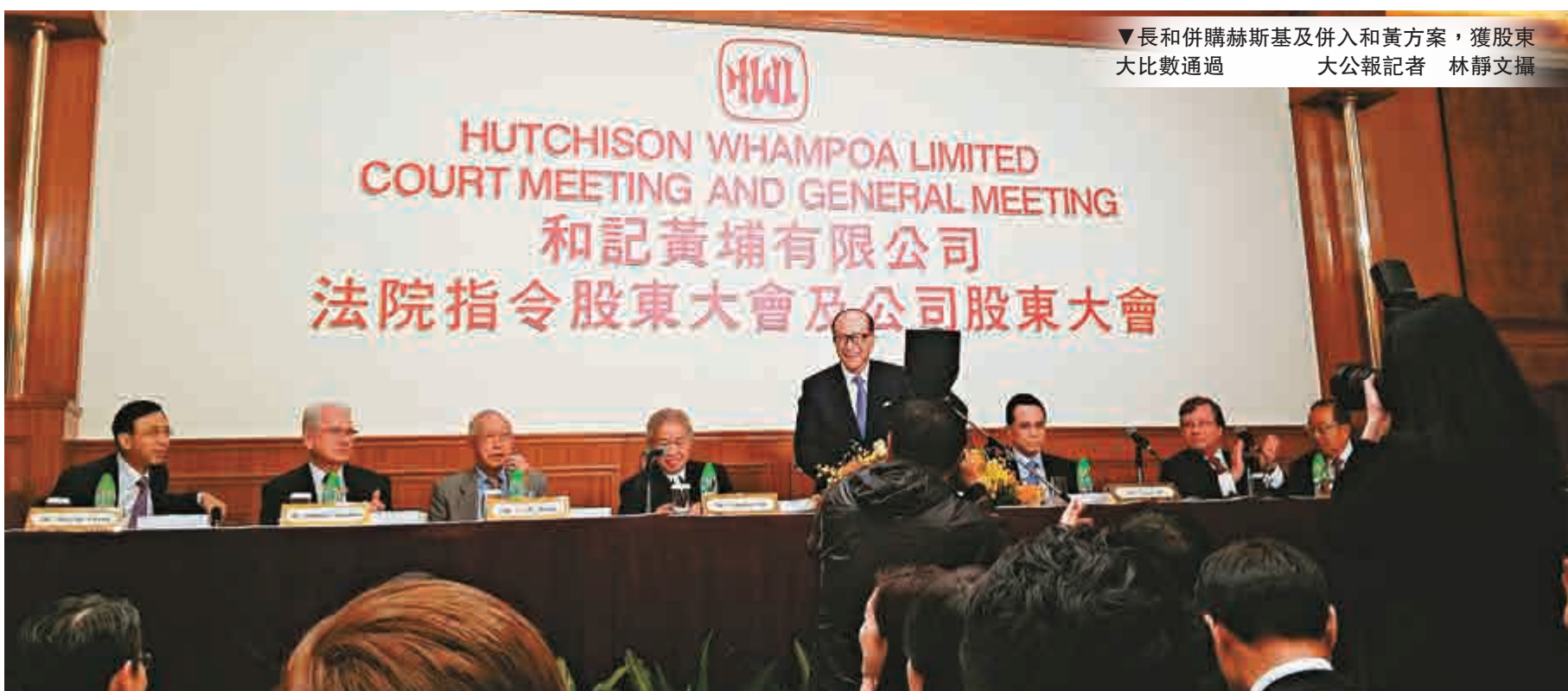
▼長和併購赫斯基及併入和黃方案，獲股東大比數通過