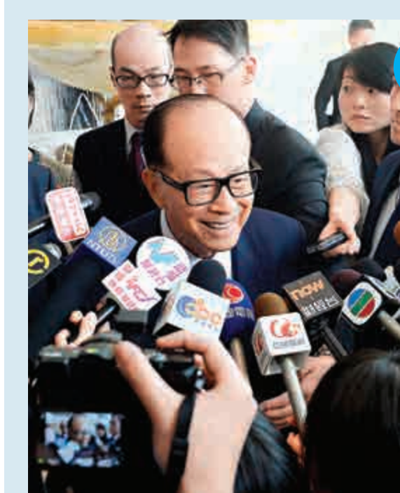
▲李嘉誠表示，兩公司合併後的派息比例必然會加大