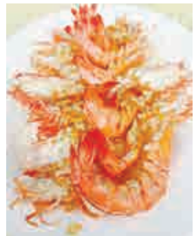
▲以蝦入饌，味鮮是賣點

這是一家典型的海鮮南方海鮮館，近門口有拾數張「排排企」的方形大紅檯，活潑的魚蝦蟹鮑以及各種貝類與螺類，在吐着泡泡。不一會，海膽炒飯上桌，一如本文開頭的景象。每一口炒飯都吃得到海膽的感覺「奢侈」且幸福，這足二人分量的炒飯裡竟有兩兩多的新鮮海膽，卻只售六十八元。幣，坐的士來都抵食。 海膽性平，含大量優質蛋白質，益心強精，其提取物可以抑制癌細胞生長，是難得的可口多食卻不會有後顧之憂的美食。 魯迅胞弟周作人先生年輕時在日本留學多年，對日本海產甚是喜愛。他到了七十多歲，仍去信多封給香港翻譯家鮑耀明，索要雲丹等食物，並自囑道：「老饕以口腹細故累人還奇，亦可笑也。」