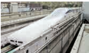
▲日本最新版的L0系列磁懸浮列車

東鐵將於6月9至12日舉行新懸浮列車試坐體驗活動，申請日期直至下周一下一結束，結果將以抽籤形式於5月下旬公布。