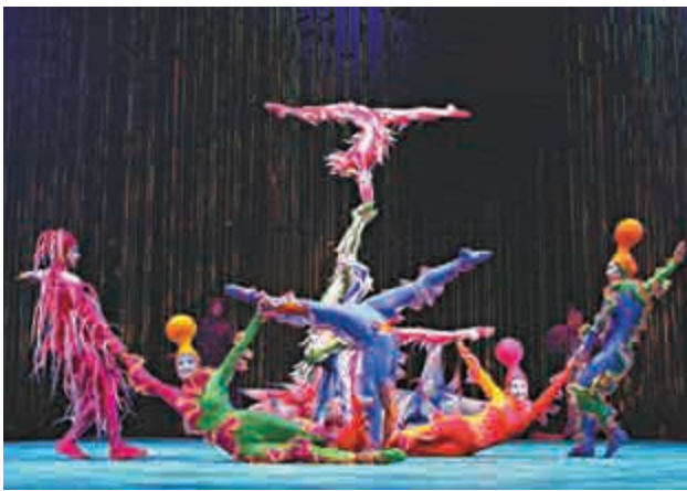
▲加拿大太陽馬戲團表演場景

自1984年在蒙特利爾成立以來，太陽馬戲團在48國、超過330個城市巡演，觀眾高達約1.6億，今年在全球將推出18個不同戲碼。近年來，太陽馬戲團經歷財務困境，2012年首度面臨虧損，全球5000名員工裁減千人。