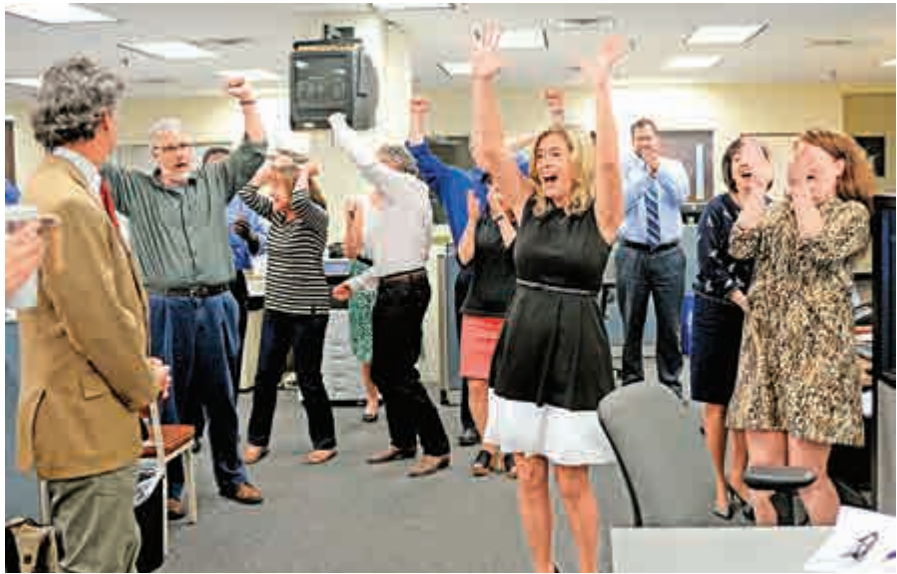
▲《信使郵報》員工20日慶祝獲得普立茲獎