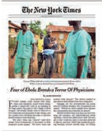
《紐約時報》獲獎的伊波拉報道

普立茲獎管理人普賴德表示，大約有1200件新聞作品參加了今年的角逐，而且今年的調查性報道和特稿寫作兩大類別允許雜誌申請，從而造成這兩獎提名量分別暴漲50%和21%。