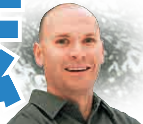
▲普立茲小說獎獲得者多爾及其獲獎作品