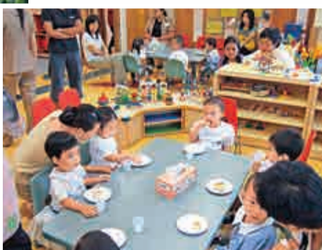
▲幼童最重要的還是能愉快學習，將所學運用出來 資料圖片