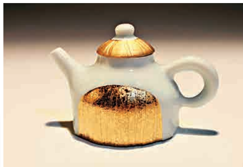
▲黃金燒在陶瓷上展現細緻的視覺效果