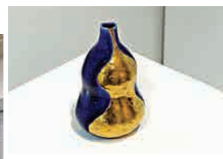
△Unit Gallery展出石山哲也的作品