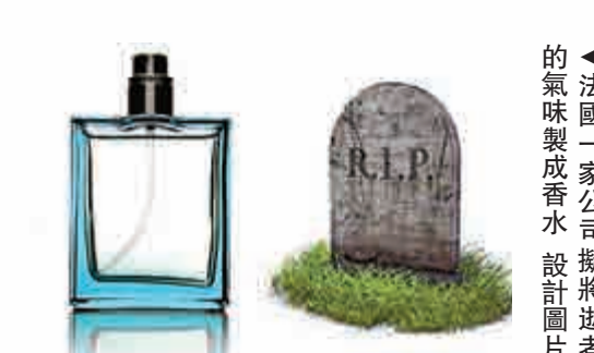
▲法國一家公司擬將逝者的氣味製成香水 設計圖片

艾帕拉特基聲稱，氣味與記憶之間連結性很強，意味着成品會提供「嗅覺的撫慰」，效果類似於亡者的照片、影片和其他紀念品。她表示，他們會為顧客量身製作香水，售價將是600美元左右。