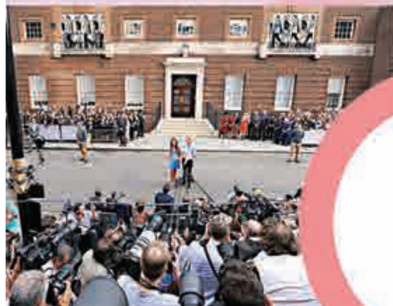
▲兩年前凱特抱着小喬治出院時，被媒體重重包圍 資料圖片

【大公報訊】綜合英國《每日郵報》、英國廣播公司24日消息：英國劍橋公爵夫人凱特的預產期就在25日，王室粉絲群情激動。有零售業專家推算，如果第二個王室寶寶是小公主的話，她可為英國帶來價值10億英鎊（約117億港元）的商機。