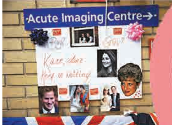
▲倫敦聖瑪麗醫院對面的牆上貼着英王室成員的照片