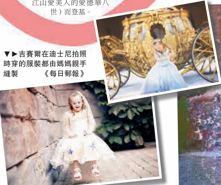
▼吉賽爾在迪士尼拍照時穿的服裝都由媽媽親手縫製