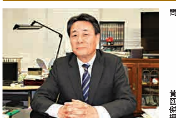
▲海江田萬里現任日本民主黨黨魁