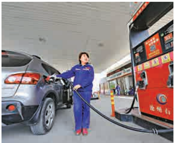
▲ 國家發改委發出通知，決定今起將汽、柴油價格每噸分別提高300元和285元

國家發改委宣布，自今日起調高汽、柴油價格每噸分別300各285元（人民幣，下同）。按調整後的汽、柴油標準品最高供應價格每噸分別爲7490元和6515元，相當於每噸分別調高4.17%及4.57%。測算到零售價格90號汽油和10號柴油（全國平均）每升分別提高0.22元和0.24元。