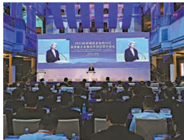
▲ 「2015中外知名企業四川行」投資推介會暨合作項目簽約儀式在四川成都舉行