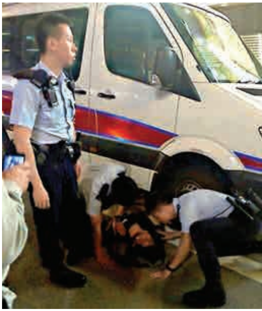
►市民企圖爬入警車車底被警員阻止 網上圖片