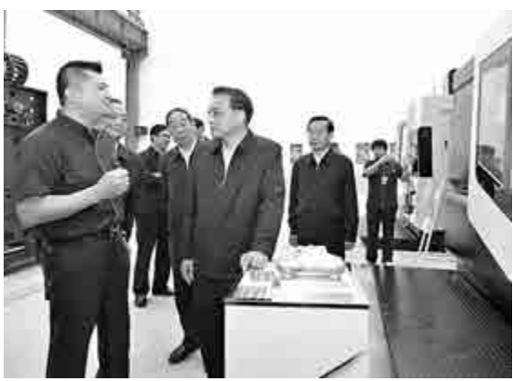
▲李克強總理（前右一）在泉州考察嘉泰數控機械有限公司

網+」的新模式，有效連接市場供需雙方、提供融資服務時，李總理很高興。他親手啓動了一筆七匹狼服裝上游的中小微企業供應鏈融資標的，這筆融資標的將為這家供應商籌集到164.2萬元的融資。