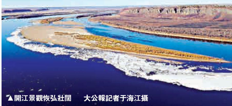
▲開江景觀恢弘壯闊