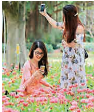
▲盛開的鬱金香吸引市民前來欣賞