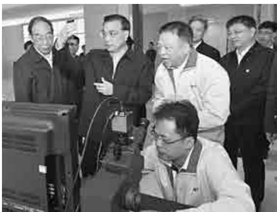
▲李克強總理（左三）考察台資企業長鴻光電（廈門）有限公司

在閩省民營經濟最活躍的泉州市考察時，李克強來到了品尚電子商務公司。該公司建立了雲訂單、產能交易、中小企業信用和互聯網金融四個網絡平台，致力於打造鞋服行業業務交易平台和互聯網金融平台，降低了小微企業經營成本。當看到公司利用「互