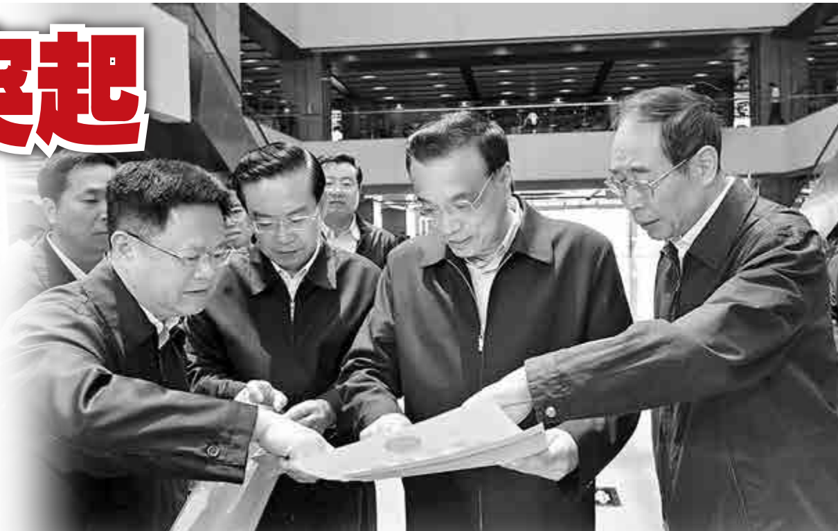
▲中共中央政研室副室長、國務院總理李克強（前右三）22日在中國（福建）自貿試驗區廈門片區象嶼綜合服務大廳了解改革經驗推廣落地、簡政放權等情況。福建省委書記尤權（前右一）、福建省長蘇樹林（前左二）、福建省副省長鄭栅潔（前左一）向李總理介紹情況

李總理又來到向航天、通信等行業供應「數控加工中心」的福建泉州嘉泰數控機械有限公司考察，當