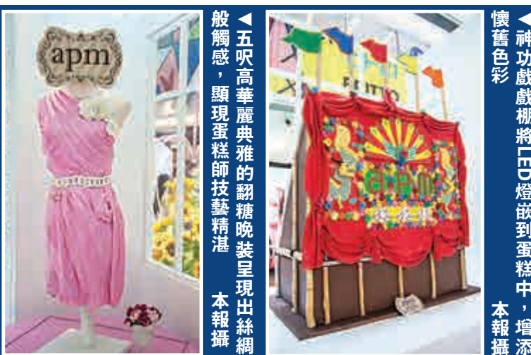
▲五呎高華麗典雅的翻糖晚裝呈現出絲綢般觸感，顯現蛋糕師技藝精湛