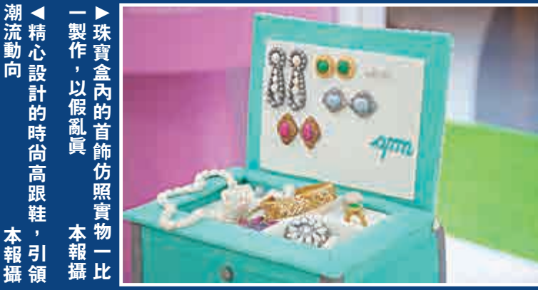
▲珠寶盒內的首飾仿照實物一比一製作，以假亂真