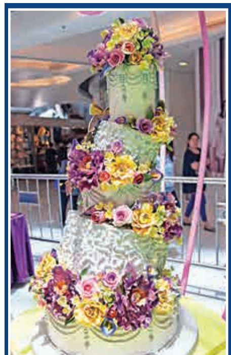
▲耗時一百小時製作的蛋糕，每一朵花都是手工製作，晾乾後逐一插放至蛋糕上