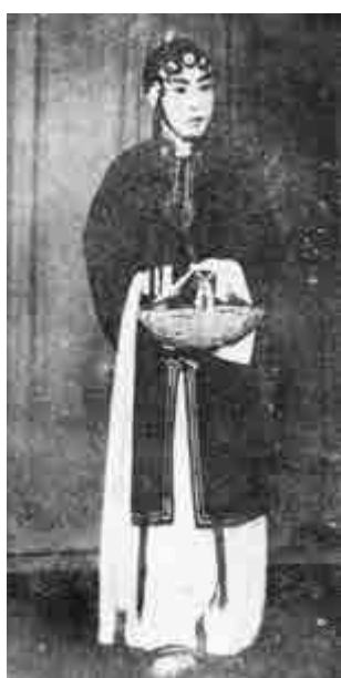
▲李正敏《趕坡》之王寶釧劇照

【大公報訊】實習記者王翠西安報道：今年適逢秦腔表演藝術家李正敏誕辰一百周年，陝西省文化廳日前舉辦紀念座談會，王小民、楊天基、楊文穎等專家及戲迷代表齊聚一堂，共同緬懷李正敏為秦腔藝術作出的巨大貢獻，探討秦腔藝術的保護與傳承。