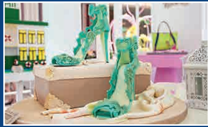
▲精心設計的時尚高跟鞋，引領潮流動向