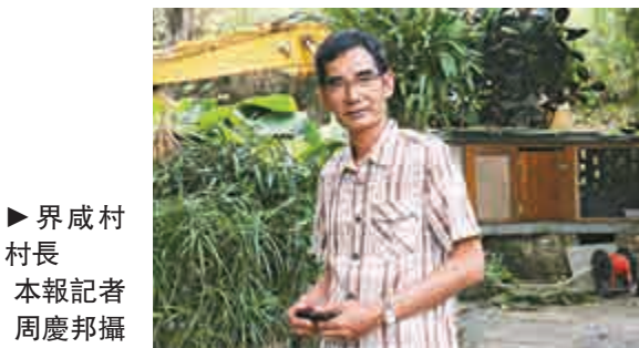
► 界威村村長

界威村村長謝先生表示，上周有直升機在附近山頭盤旋。至本周一，十多名探員扮成行山客前往布防，及向他借用天台。但探員沒有解釋做什麼工作，離開時指「有需要時會借用天台」。這宗行劫及綁票案在前晚八時許曝光，警方通令各區進行圍捕悍匪進行的捷進行動，令各區交通大受影響，網上旋即流傳涉及一達2800萬元巨劫案，至凌晨時分警方始發稿稱案件涉及行劫及綁票案，警方在救出肉參後在西貢一帶動用過百警員及直升機搜捕匪徒。