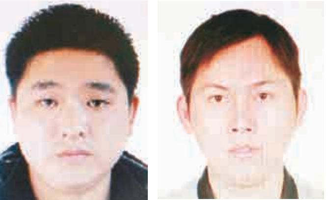
▲警方追緝的其中兩匪