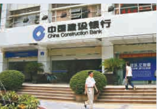
▲建行有望成為首家在瑞士設立分支機構的中資銀行

早前已有報導，指中國銀監會已批准建行籌建蘇黎世分行，一旦得到兩國監管層批准，建行將成為首家在瑞士設立分支機構的中資銀行。報導指，瑞士央行和人行有意在瑞士設立人民幣清算業務，將有助於促進人民幣的跨境交易。若消息確實，建行需在設立分行後向人行申請人民幣清算資格。瑞士正與包括盧森堡、德國和英國在內的一系列國家競爭成為人民幣離岸交易中心，以滿足市場上對使用人民幣的需求。