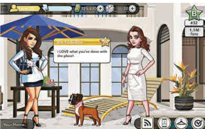
▲Glu Mobile開發的遊戲包括《金·卡戴珊·荷里活》等，同時計劃明年上半年推出以明星布蘭妮為形象的手遊