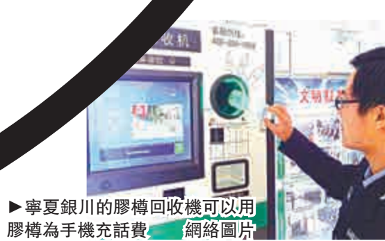
▲寧夏銀川的膠樽回收機可以用膠樽為手機充話費

據悉，今年3月起，銀川市將陸續投資1851萬元，在居民小區、學校和公共場所試點推廣生活垃圾分類收集回收系統。在越來越多城市面臨「垃圾圍城」危機的當下，探索更加科學環保的垃圾處理方式，成為中國多地政府和環保部門共同努力的方向。目前，上海垃圾分類減量工作已實現了每年減5%的目標，而杭州也推出「二維碼」免費垃圾袋，將實現住戶垃圾分類情況可追溯。 （新華社）