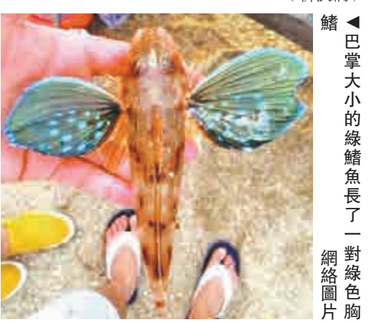
▲巴掌大小的綠翅魚長了一對綠色胸鰭