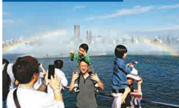
5月2日下午，有亞洲最大音樂噴泉群之稱的南昌秋水廣場音樂噴泉，在陽光的照射下歡舞，一條彩虹若隱若現，與碧藍的天空交相輝映，吸引了眾多遊客前來觀賞。