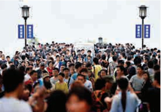
▲杭州西湖斷橋上擠滿了遊客

此外，「五一」假期的號角響起，擁擠還在高速上上演。小型普通客車實施抬桿不發卡的免費政策，高速無疑迎來一波出行高峰，五一小長假第一天從0時開始，高速公路的繁忙景象再次如期而至，早上6點20分開始事故便開始高發。