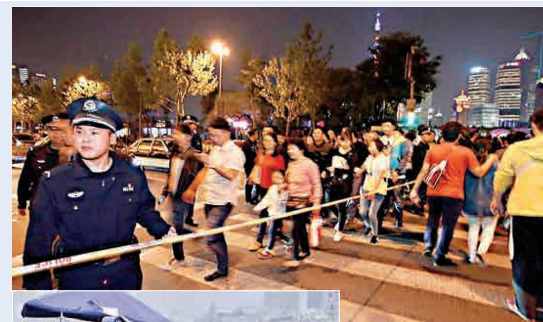
▲上海警察在路口拉起繩子疏導人群，按照紅綠燈間隔時間統一單向放行

此外，客流量較大時，警方將在外灘沿線的路口設置卡口，遠端控制引導客流均衡進入外灘。