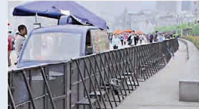
▲5月1日，上海警方在陳毅廣場附近為疏導人潮而架設的鐵馬