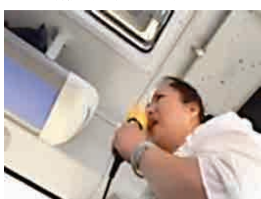
▲雲南女導遊因嫌棄遊客買東西少而辱罵遊客 視頻截圖

5月1日是五一小長假第一天，但有遊客通過微信視頻爆料稱，在雲南旅遊時因購物少被女導遊