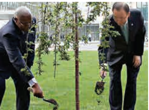
▲聯合國秘書長潘基文（右）5日和聯大主席庫庫薩種下紀念二戰勝利的和平樹