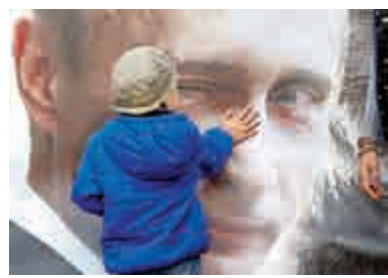
▲一名俄羅斯兒童6日撫摸聖彼得堡街頭的普京海報

對於俄羅斯、對於普京來講，二戰勝利70周年是十分值得紀念的日子。普京說：「英國在這場戰爭中犧牲了2500萬人？35萬？50萬？相比起蘇聯，這都是小巫見大巫。蘇聯為二戰犧牲了2500萬人。」