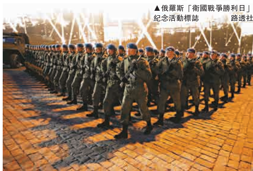
▲俄羅斯軍人4日在紅場綵排

北約聯軍司令部司令弗格森5日表示，北約總部6月份將從意大利的那不勒斯搬遷到羅馬尼亞，以便提升應對俄羅斯在烏克蘭行動以及其他挑戰的能力。