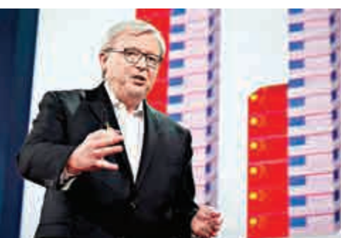
▲澳洲前總理陸克文

出席論壇的中國國務院新聞辦公室副主任崔玉英表示，中國存在着環境、腐敗等不少問題，要解決這些問題，沒有靈丹妙藥，深化改革是唯一出路。