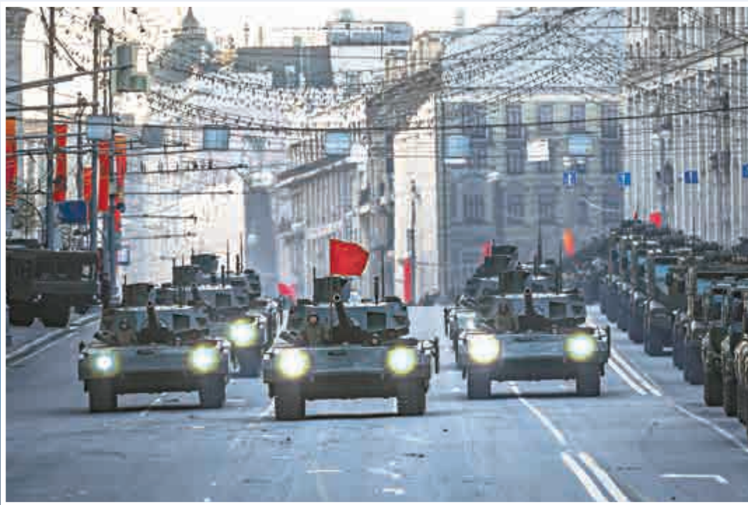
▲俄羅斯新型T-14坦克5日在莫斯科街頭綵排