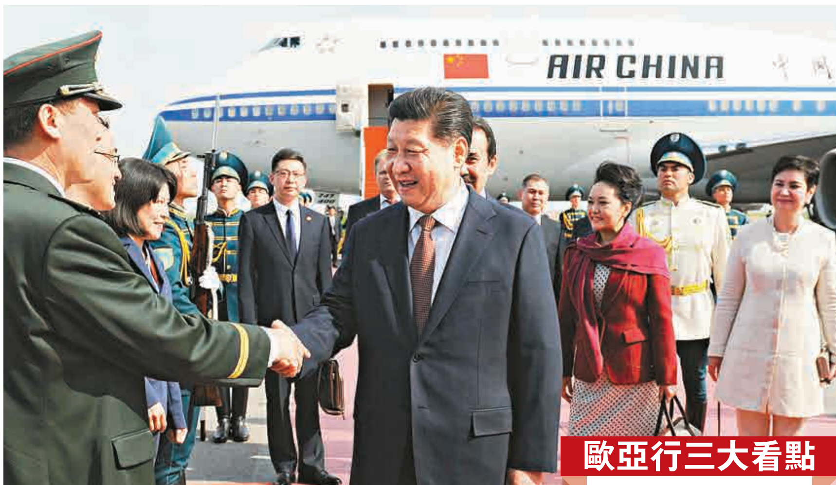
▲7日下午，中國國家主席抵達哈薩克斯坦首都阿斯塔納