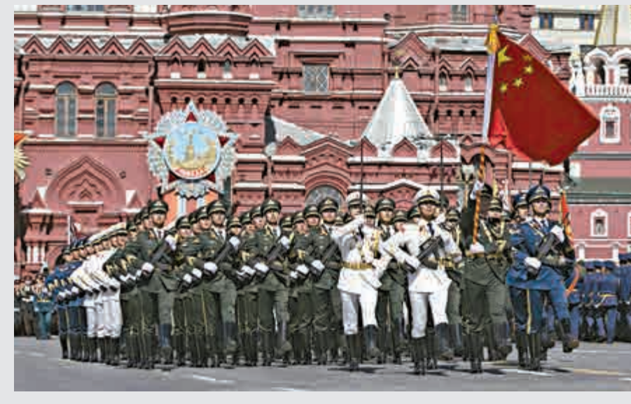
▲7日，解放軍三軍儀仗隊在紅場中列隊行進

接受習主席和其他國家領導人，以及全世界人民的檢閱，意義非常重大。這次閱兵我們的三個執行分隊長，陸軍、海軍、空軍平行成排，一起行進，這在整個隊伍的編成中是史無前例的。此外，這次閱兵的着裝都是新式禮賓服，也是在紅場上向全世界人民展示中國的軍服。」