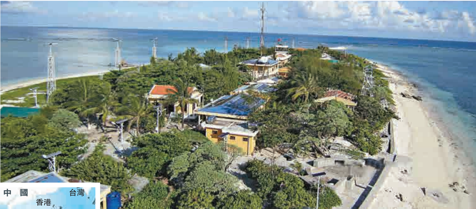
越南在敦謙沙洲建有多座建築物

敦謙沙洲（西方稱Sand Cay）和西礁（西方稱West London Reef）均為中國固有領土，中國政府對此擁有無可爭辯的主權。近年越南在南海所佔島嶼持續增強軍事部署。 敦謙沙洲位於太平島以東，略呈長橢圓形，和太平島間有一串礁體相連，其中最大的一塊為中洲礁，其上有一個潮漲時面積達100平方米的小沙洲。名字來自1946年接收該島的「中業」號艦長李敦謙。中國漁民向稱敦謙沙洲為馬東、黃山馬東。此沙洲原本為台灣派軍駐防。1974年，越南借台軍躲避颱風撤回太平島時侵佔至今。 西礁是南沙群島一座珊瑚環礁，位於尹慶群礁西部。礁東側有一白色沙洲，中國漁民常在此曬海參。因該環礁形似鼻孔，中國漁民俗稱大弄鼻。 【大公報記者賈磊根據公開資料整理】