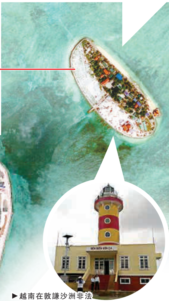
越南在敦謙沙洲非法建設燈塔