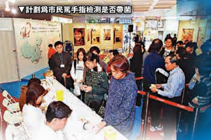
▼計劃為市民篤手指檢測是否帶菌