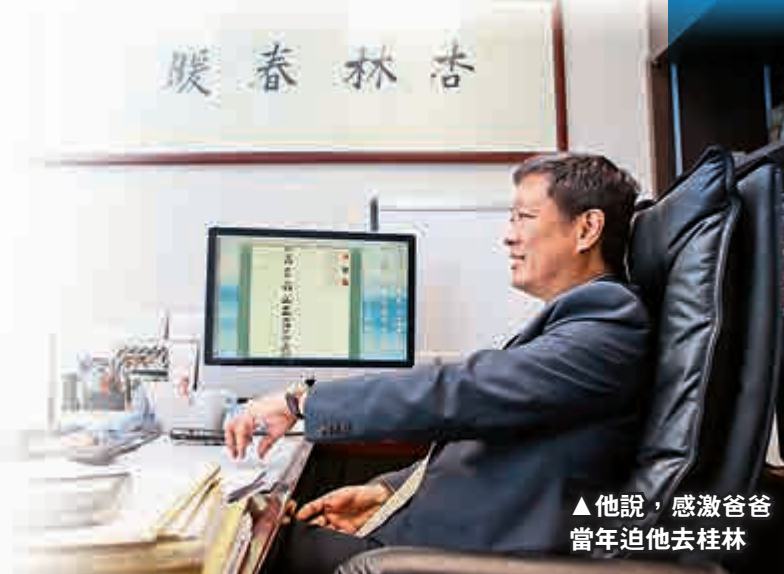
▲他說，感激爸爸當年迫他去桂林