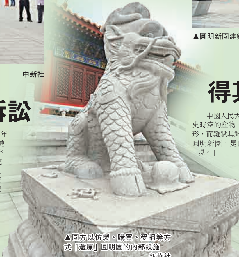
▲園方以仿製、購買、受捐等方式「還原」圓明園的內部設施

明園也曾啓動圓明園數字復原工程。去年9月，北京圓明園曾宣布工程取得重大進展，已實現圓明園全貌90%以上的數字復原。共清理收集檔案10000餘件，完成4000幅復原設計圖紙，2000座數字建築模型，41個圓明園景區，128個時空單元的復原研究工作。其數據規模之龐大、史料之珍貴，在世界遺址園林修復史上尚屬首次。當時圓明園還推出了圓明園數字導覽系統軟件，遊客只需租用園內提供的手機，即可輕點圖標，旋轉角度，100多年前、360度三維景觀的瓊樓玉宇、亭台樓閣便出現在屏幕上。