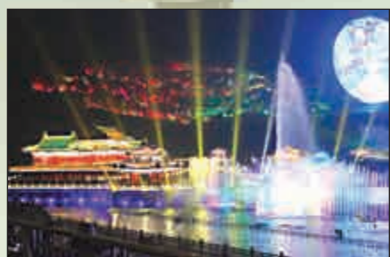
▲橫店圓明新園內的夜晚水秀表演