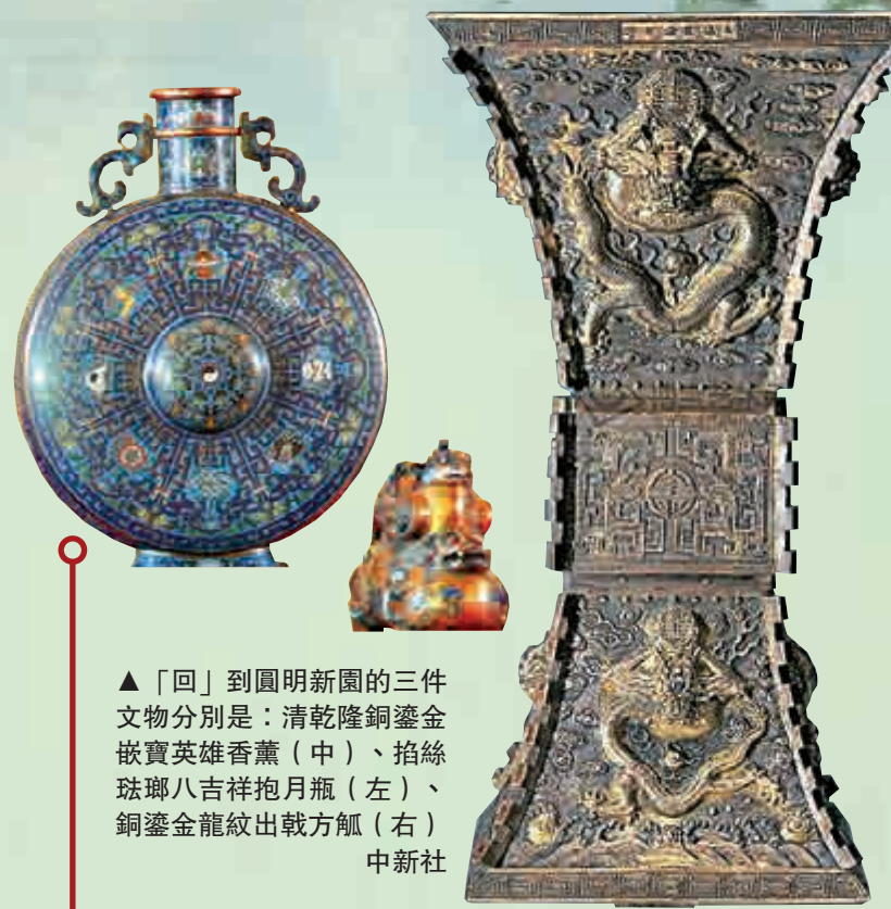
▲「回」到圓明新園的三件文物分別是：清乾隆銅鑲金嵌寶英雄香薰（中）、掐絲琺瑯八吉祥抱月瓶（左）、銅鑲金龍紋出戟方觚（右）