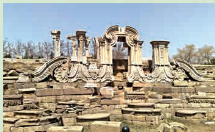
▲被譽為「萬園之園」的圓明園在1860年毀於英法聯軍之手，圖為北京圓明園遺址公園 資料圖片

對此，橫店集團創始人、復建工程總指揮徐文榮認為，圓明新園是以實物形式對當今民族智慧的展現，將與北京圓明園形成一南一北、一今一古的呼應。北京圓明園方面則表示，圓明園具有唯一性的文化遺產，若遇侵犯其知識產權的行為，將適時採取法律行動。