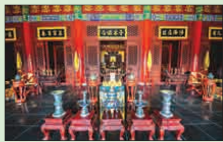
▲圓明新園復原「鴻慈永祐」

圓明園是中國著名的皇家園林，於1860年遭英法聯軍焚毀，文物被掠奪的數量粗略統計約有150萬件。在此次復建過程中，橫店曾組織100多位專家多方收集散落民間的文物和藝術品，盡全力還原圓明園的內部設施。