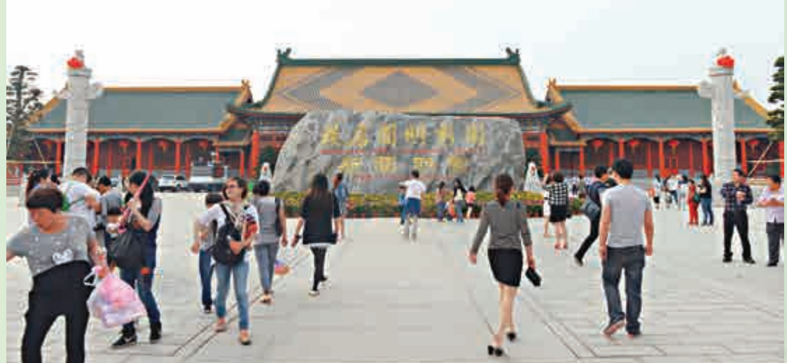
▲按1：1比例復建北京圓明園95%建築群的「圓明新園」正式開園 中新社

圓明園坐落於北京西郊海淀，與頤和園緊相毗鄰。它始建於康熙46年（1707年），由圓明、長春、綺春三園組成。佔地350公頃，建築面積近20萬平方米，是清朝帝王在150餘年間創建和經營的大型皇家宮苑。圓明園曾以其宏大的地域規模、傑出的營造技藝、精美的建築景觀、豐富的文化收藏而享譽於世，被譽為「萬園之園」。1860年10月，圓明園慘遭英法聯軍洗劫並付之一炬。