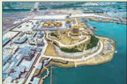
▲從空中俯瞰圓明新園