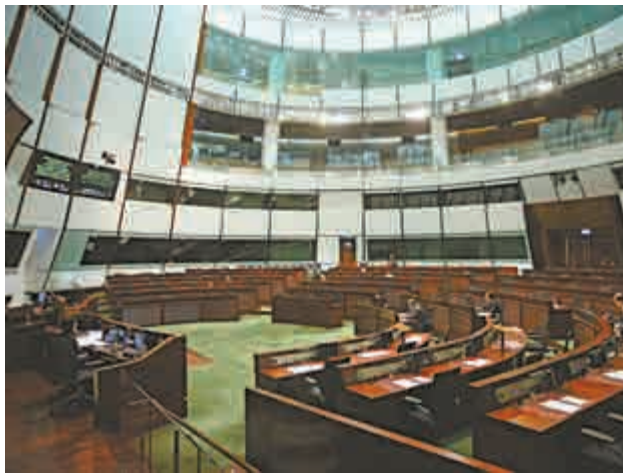
▲ 立法會昨進行財政預算案辯論，反對派繼續拉布

由於會議時間不足，撥款要在下次會議上再討論。當局指工程標書將於下月底到期，若未獲撥款便要重新招標。