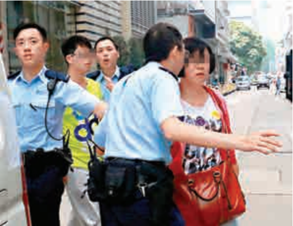
▲ 涉嫌襲擊女導遊的男子及其母親被帶署調查