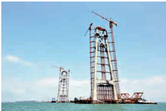
▲ 青州航道橋「中國結」吊裝現場