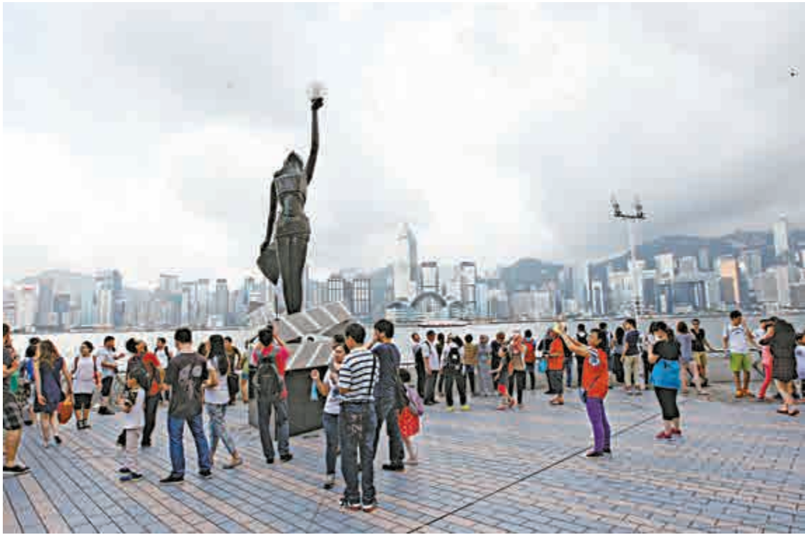
▲五一黃金周期間，來港內地團增加，但今年首四月內地團減少了兩成

旅遊界立法會議員姚思榮亦稱，據他了解，現時每日約有400團，跌幅較早前大為收窄。他稱現時不算訪港旅遊旺季，酒店入住率有幾個百分點的下降，價錢亦有約一成的跌幅，令團費有減價空間，加上內