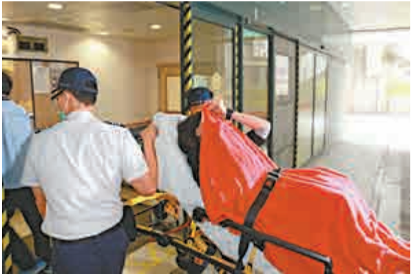
▲ 女導遊遭人拉扯手部受傷，送院治理