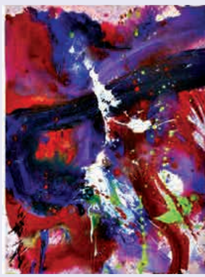
▲白髮一雄《某個片段》，估價三十萬到五十萬港元