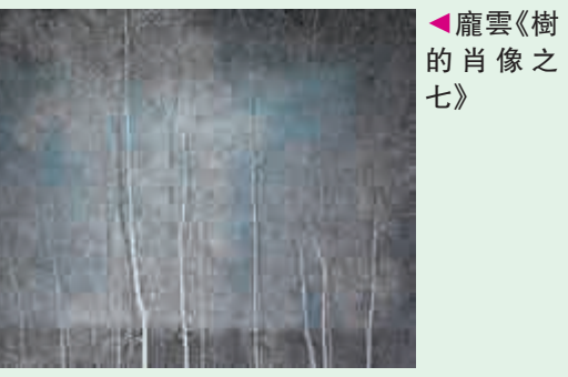
▲龐雲《樹的肖像之七》