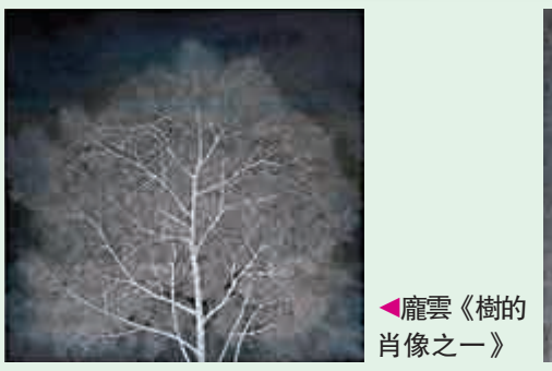
▲龐雲《樹的肖像之一》