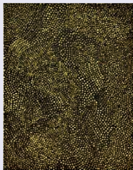
▲草間彌生《無限的網》，估價一百八十萬到二百八十萬港元