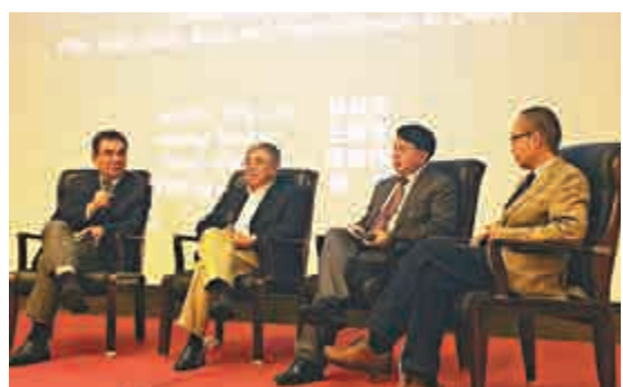
▲「中國自貿區與開放新階段」高峰論壇15日在上海舉行，林毅夫（左）與其他經濟學家深入研討新常態下自貿區國家戰略的推進策略和對外開放的新構想

【大公報記者夏微上海十五日電】北京大學國家發展研究院名譽院長、原世界銀行副行長林毅夫15日在「中國自貿區與開放新階段」高峰論壇上表示，中國「一帶一路」戰略的提出，不僅有利於自己的利益