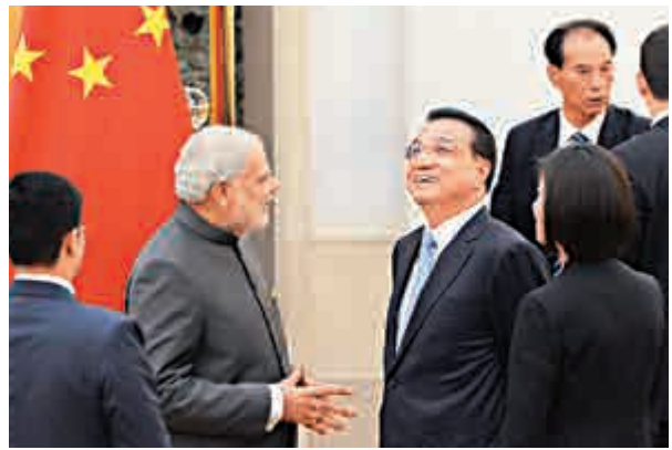
▲李克強與莫迪會見記者後交談

李克強當日還與莫迪共同出席首屆中印地方合作論壇並致辭。李克強表示，雙方完全可以通過智慧工作，建設智慧城市，實現智慧生活。兩國中央政府將為雙方地方開展合作添助力，開綠燈。