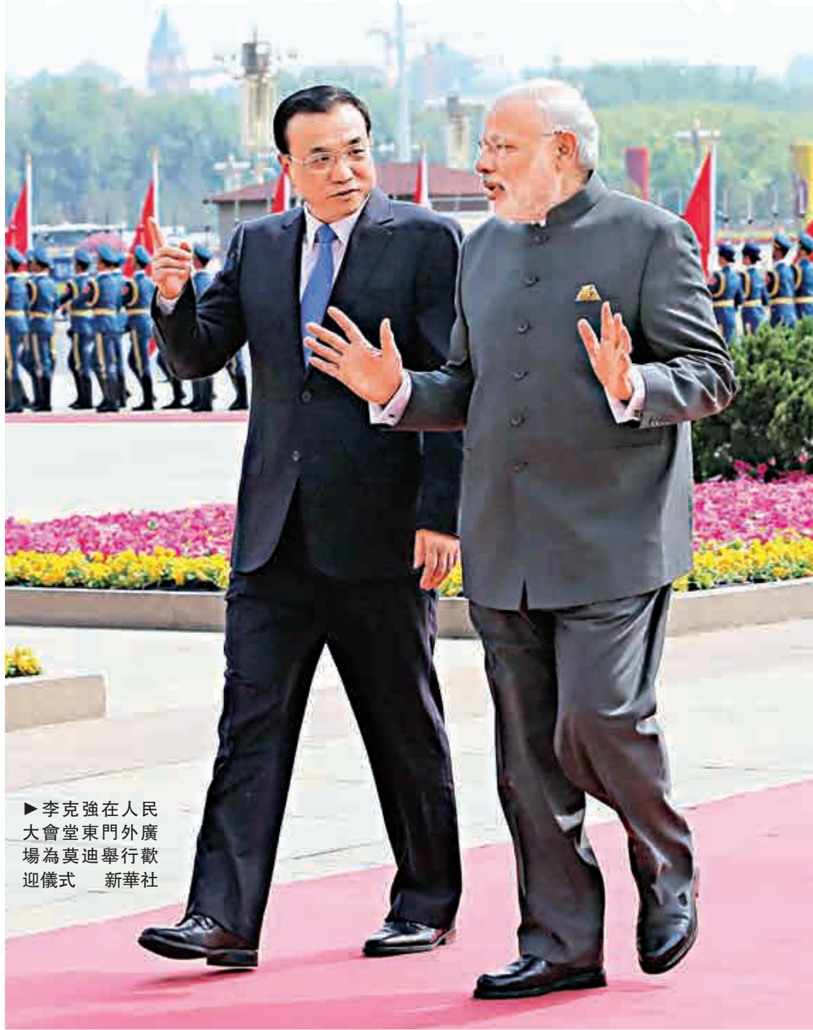
▶李克強在人民大會堂東門外廣場為莫迪舉行歡迎儀式