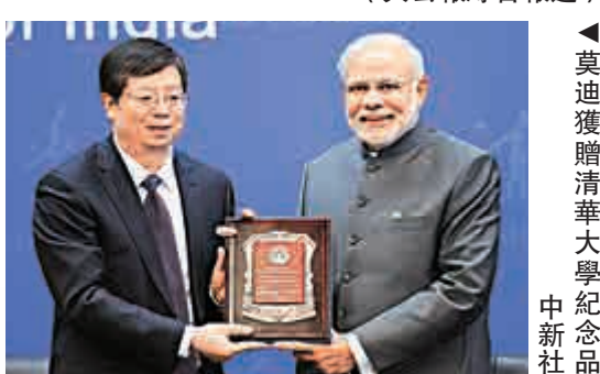
▲莫迪獲贈清華大學紀念品

15日下午4時整，灰色着裝的莫迪走進清華大學主樓。隨後莫迪開始演講，內容涉及了中印交流史、印度發展的相關舉措及中印攜手復興等，還提到了用創新的方法解決邊界問題，莫迪首先用中文開場稱，「我真的很高興來到著名的清華大學，你們覺得，我說中文，可不可以？可以嗎？」輕鬆的互動贏得了現場一陣笑聲和掌聲。