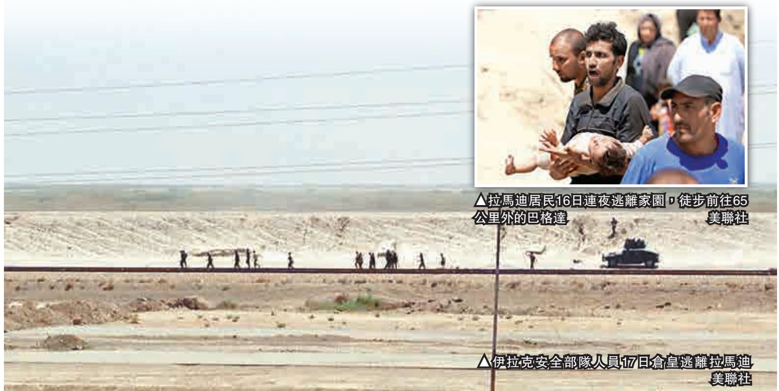
▲拉馬迪居民16日連夜逃離家園，徒步前往65公里外的巴格達