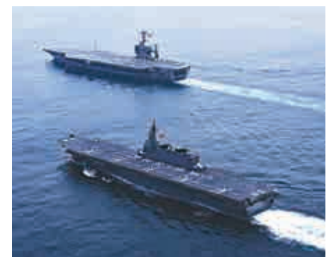
▲日本「出雲」號護衛艦(下)18日送別「喬治華盛頓」號

「喬治華盛頓」號於1992年服役，2008年9月部署於駐日美軍橫須賀基地，是繼「中途島號」、「獨立」號、「小鷹」號之後，第4艘部署於日本的美軍航空母艦，也是第1艘部署於日本的核動力航空母艦。