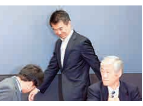
▲大阪市長橋下徹(中)17日宣布將從政界引退

下一直揚言，否決大阪都構想就是否定他的政治基本理念，他只好離開政界。但對安倍政權來說，維新黨雖非最大在野黨，卻因彼此不少主張接近，是安倍政權與在野黨合作、溝通的重要對象和渠道。