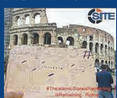
▲ISIS支持者手持標語在羅馬競技場外拍照

ISIS近幾個月來大有斬獲，向利比亞內地推進，拿下包括強人卡扎菲老家蘇爾特在內等數個城鎮。