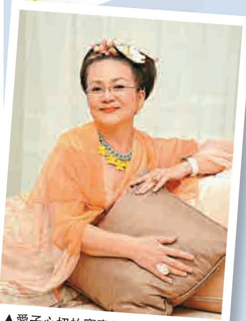
▲愛子心切的寶寶姐非常尊重兒子的想法