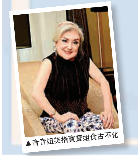
▲音音姐笑指寶寶姐食古不化