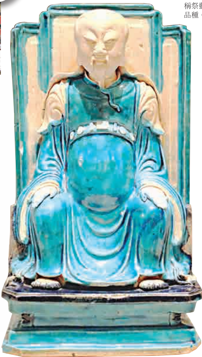
▲吉慶堂於開設早期的商舖外觀