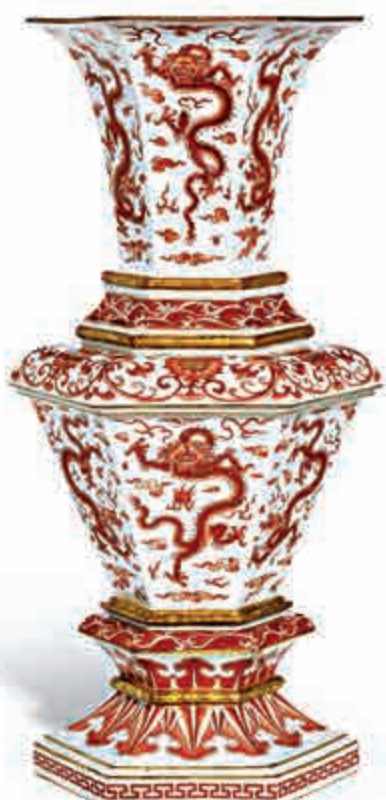
▲清雍正正鑒紅彩描金雲龍紋六方花瓶