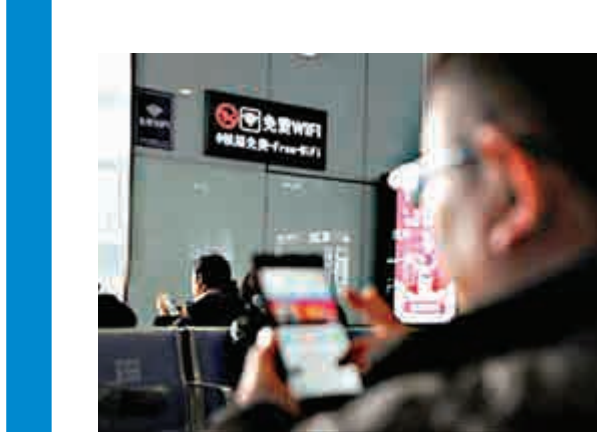
▲到2017年底，中國直轄市、省會城市等主要城市寬帶用戶平均接入速率超過30Mbps。圖為旅客正用車站內WiFi上網

在19日的《民聲熱線》節目上，記者當面追問神志雄：廣東的免費Wi-Fi到底何時才有