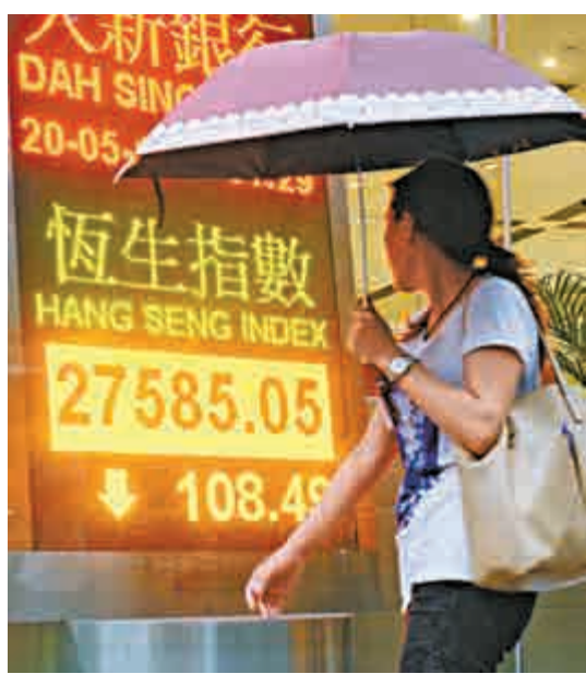
恒指先升後倒跌，回吐逾百點