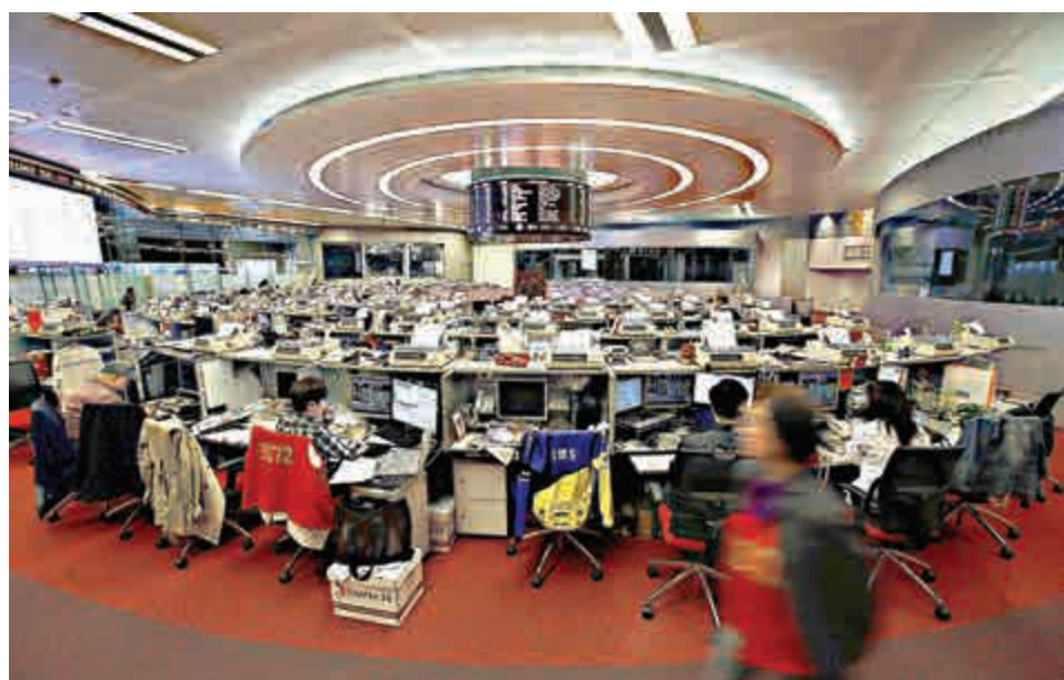
▲港股大時代風險浮現，多隻熱炒股份「跳崖」式下跌