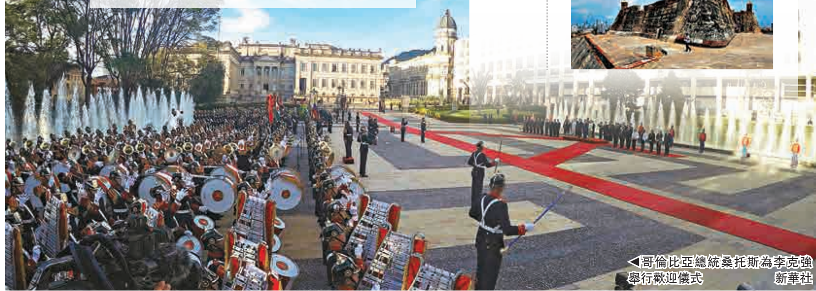
▲哥倫比亞總統桑托斯為李克強舉行歡迎儀式

哥倫比亞是中國在拉美的第五大貿易夥伴，中國是哥倫比亞全球第二大貿易夥伴。2014年，雙邊貿易額156.4億美元。（新華社）