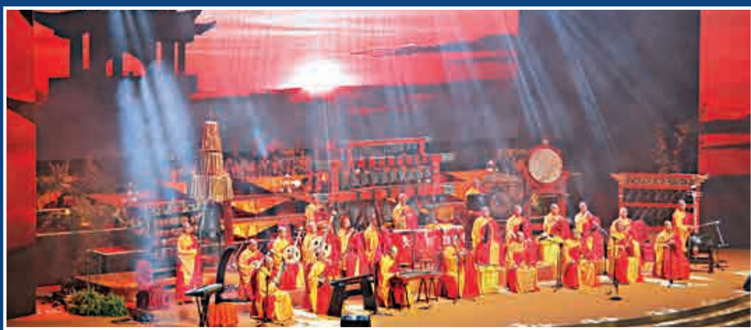
▲千年梵音配以舞台效果，直達觀眾內心

除特別註明外，其他活動可提前於 rsvp@asiaweekhk.com 登記參加。