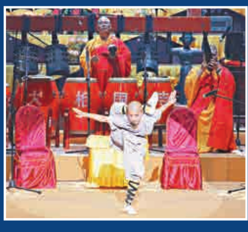
▲少年武僧的中國功夫令人驚嘆