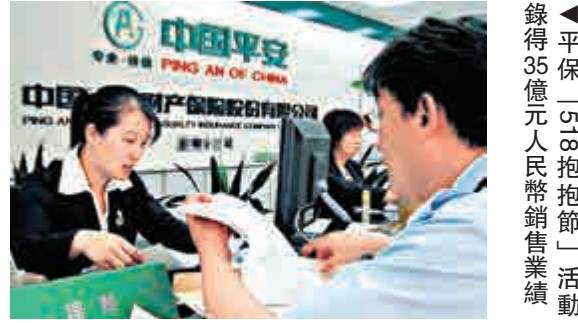
▲平保「518抱抱節」活動錄得35億元人民幣銷售業績

期內，平保集中上線22款明星保險產品，消費者通過手機或PC端訪問活動頁面購買，獲「抱抱節」主力消費人群80後熱捧。在「518抱抱節」的帶動下，平安壽險、產險、健康險相關產品線下銷量均有顯著提升，超30億元。活動線上提升尤爲亮眼，平安車險在直通車險、好車主APP兩個渠道合計售出4.3億元，較活動前期環比提升62%及129%。