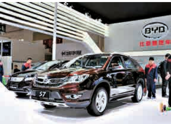
▲比亞迪電動車發展計劃受惠國策

「跑贏大市」。比亞迪昨停牌，以待刊發有關建議非公開發行公司A股之公告。停牌前報54.5元。