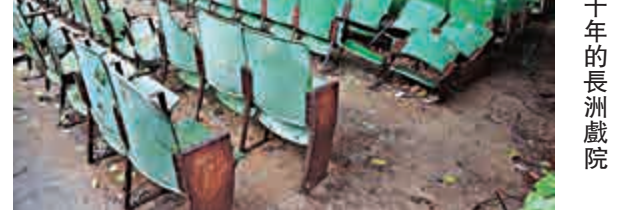
棄置逾二十年的長洲戲院

俱佳矣，長洲戲院結業後，島上再無戲院。業權幾番轉手，建築物卻沒有任何動靜，終日重門深鎖。這座已被評為三級歷史建築的戲院，向街的立面依舊，但售票大堂後面卻出現露天空間，原因是部分屋頂因長期欠缺保養而塌下來。由於日曬雨淋，地台破碎，牆身斑駁，座椅亦生鏽歪倒。新業主準備將戲院連同鄰近地皮發展為食肆和商店行業，不知道日後可否保留部分較完整的座椅，為長洲居民以至遊人帶來一點回憶？