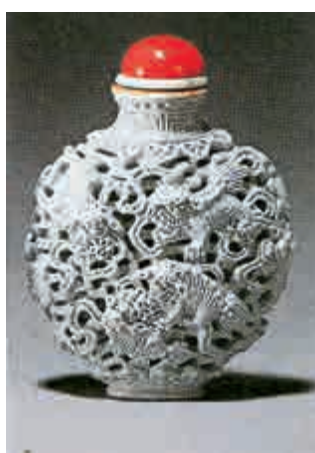
玲瓏鑲空，早於隋、唐、江西洪州窯已燒造；但甚粗陋及多缺點。直至明初永樂年間，才突飛猛進，玲瓏鑲空精美非凡，工藝圓熟高超。清代到乾隆時期，除了轉工瓷瓶和轉頭等品種外，玲瓏鑲空也臻高度水準。嘉慶乃秉承其餘粹。

也者，猶如玉石竹木的透雕藝術；表面看來，好似鑲空而成的紋飾，圖案或圖畫。根本上是瓷胎雕鏤後，細細上釉，再依嚴格程序燒成，難度高且複雜。清代中期不論官、民窯器。幾乎全屬單色釉，以白釉者最多。如圖的淡灰藍釉單色（壹鈕見為珊瑚製成），與深藍單色者同樣較少見。其實清末民初以後，始發展至黃、紅、綠等一器多色的彩色玲瓏瓷。近仿乾隆、嘉慶年款的偽品。孔眼幾全用機械戳製，並非手工刻鏤；只要細察比較，則可分辨。