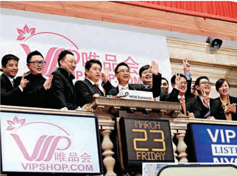
◀唯品會早於二〇一二年三月二十三日在美國紐約證券交易所上市時一景

有分析人士指出，中概股遭遇美國律師行調查或狙擊已司空見慣，其背後甚至已經形成一條成熟的利益產業鏈，而產業鏈中負責「衝鋒陷陣」的就是那些做空機構和這個做空產業鏈中的受益者。如果有投資者因訴訟獲得賠償，負責集體訴訟的律師可按賠償額收取一定律師費，有時比例或高達50%，