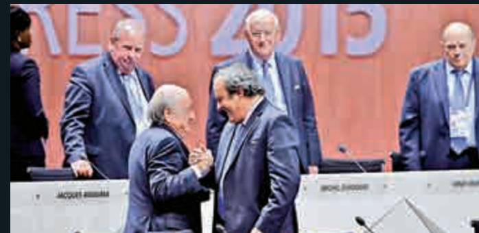
▲白禮達左5月29日與柏天尼握手

白禮達的女兒科琳日前表示，父親是陰謀受害者，歐足協才是黑勢力。「我不知道你是不是會稱他們（歐足協）為黑勢力，但去年9月和10月的時候，他們一直在謀劃逼我父親下台。我父親不會隨便拿別人的錢，他不是那種人。」