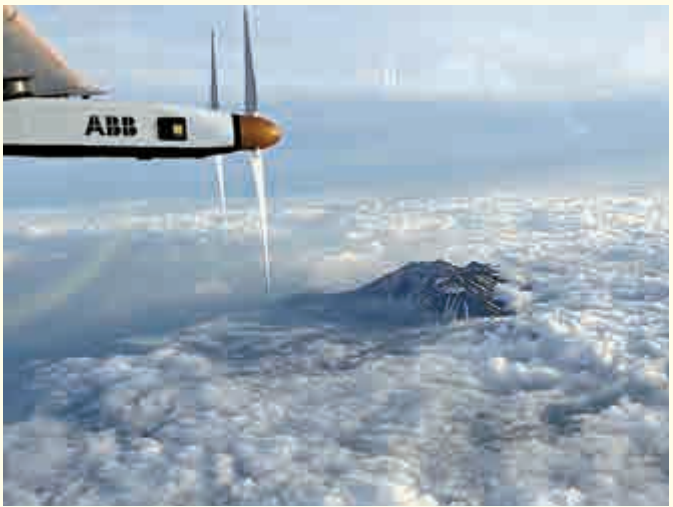
▲「太陽動力2號」因惡劣氣候降日本

「太陽動力2號」的航程3月自阿布扎比啟航，途經阿曼、印度、緬甸和中國。自南京飛往夏威夷這一段是12段航程中的第7段，距離最遠也最危險。