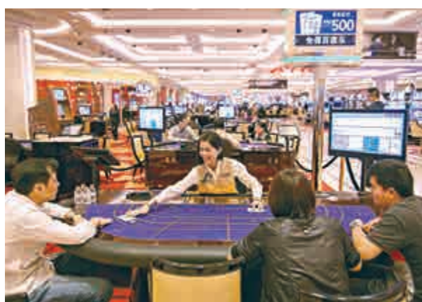
美銀料澳博彩收入續跌

法巴列出亞洲區(除日本)內ROE贏家股，其間18隻股份具有10%以上潛在股價升幅，包括高鑫零售(06808)及遠東宏信(03360)。高鑫零售昨日股價跌1.3%，報6.65元；遠東宏信跌1.3%，報7.63元。