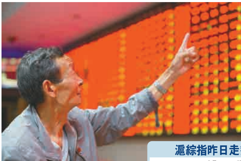
做多情緒濃烈，A股周二尾盤發力升1.7%，重回4900點 新華社