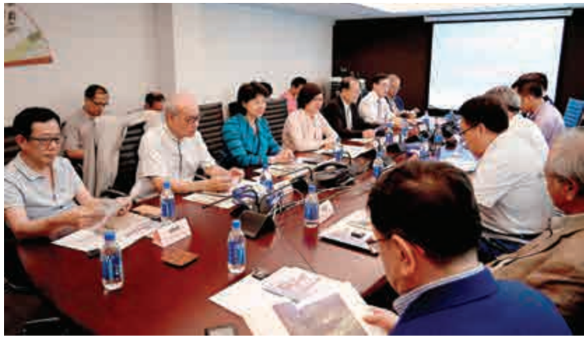
▲海上絲路「香江水&香山情」文化座談會