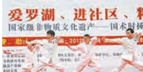
▲非物質文化遺產之肘捶表演

【大公報訊】記者王一梅海壇報道：在第十屆中國遺產文化日（六月十三日）到來之際，羅湖舉辦為期九天的首屆非遺文化周，以「一半山水一半城，美麗羅湖中國夢」為主題，開展系列非遺展示展演展覽。