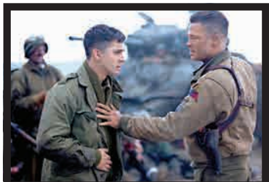
▲《7》片跟《戰逆豪情》（圖）一樣，都有「不要傷害無辜平民」的劇情