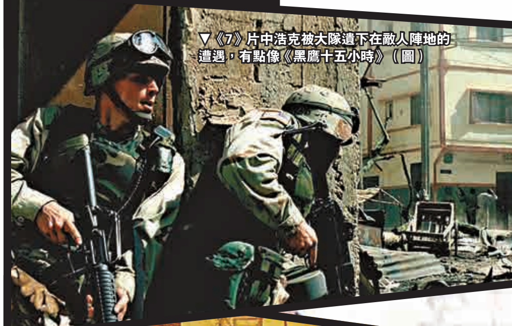
▼《7》片中浩克被大隊遺下在敵人陣地的遭遇，有點像《黑鷹十五小時》（圖）