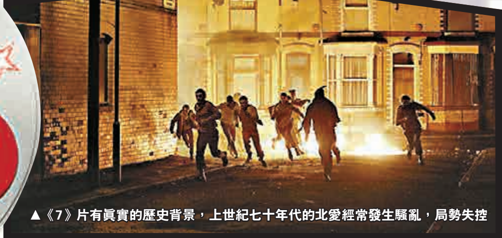
▲《7》片有真實的歷史背景，上世紀七十年的北愛經常發生騷亂，局勢失控